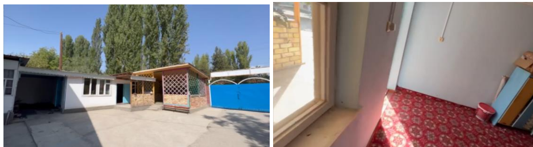
Рисунок 3. Фотографии детского сада