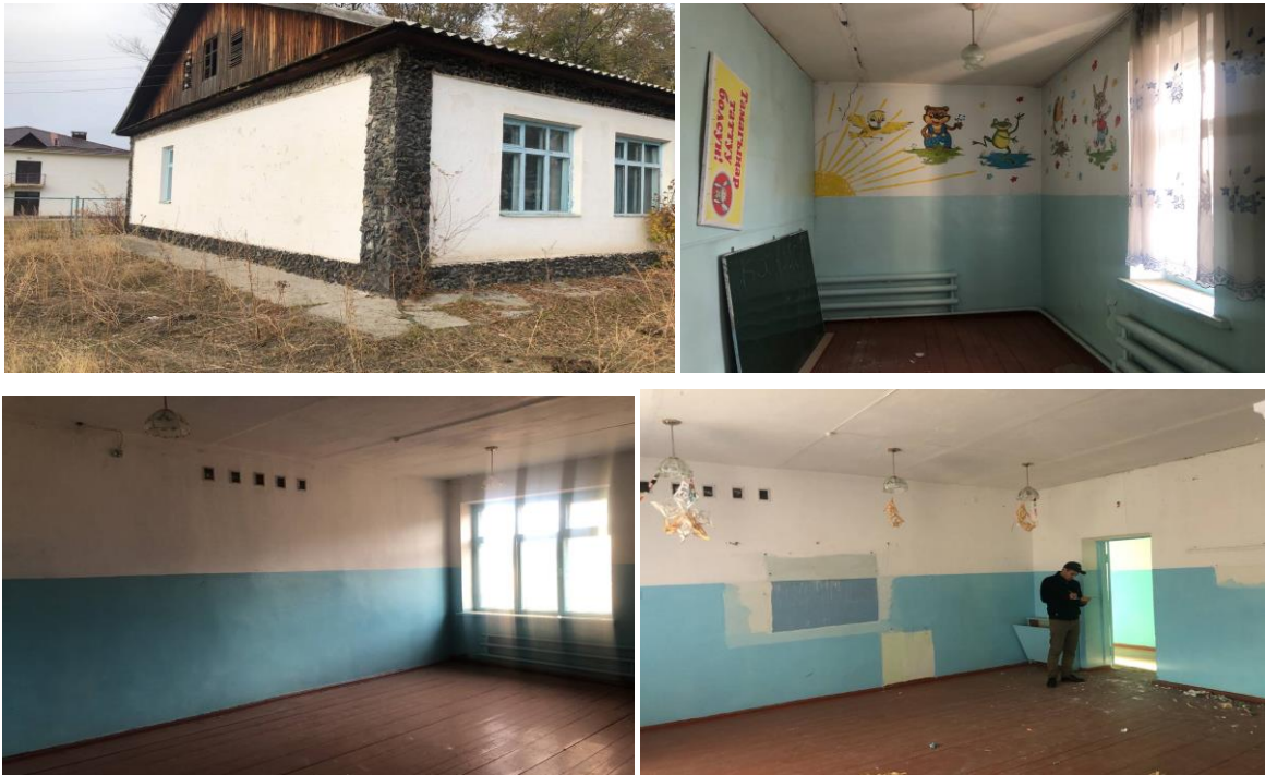
Рисунок 3. Фотографии детского сада