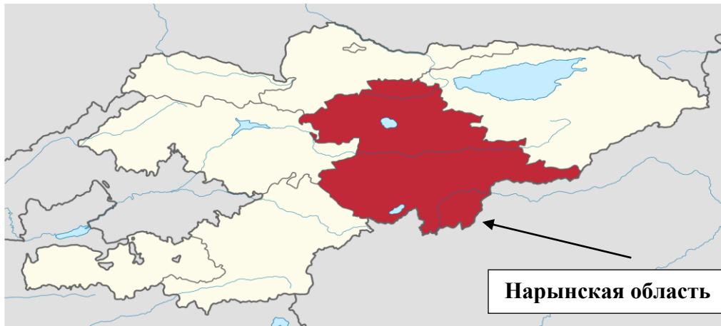
Рисунок 1. Местоположение района