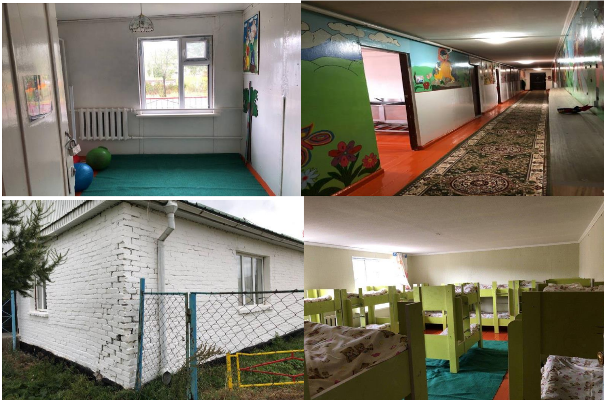
Рисунок 3. Фотографии детского сада