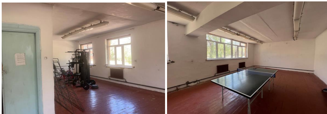
Рисунок 3. Фотографии здания