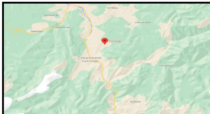
Рисунок 2. Место расположение объекта