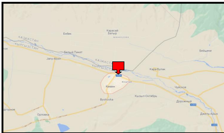
Рисунок 2. Место расположение объекта

Г. Кемин административной центр Кеминского района Чуйской области Кыргызской Республики. По данным переписи в селе проживает 8 169 человек 2 . В данном городе расположено здание детского садика. Для создания ОДС кратковременного пребывания в вышеуказанном здании требуется провести ремонтно-восстановительные работы.