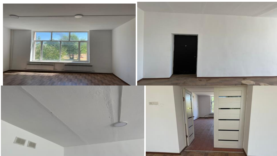
Рисунок 3. Фотографии детского сада