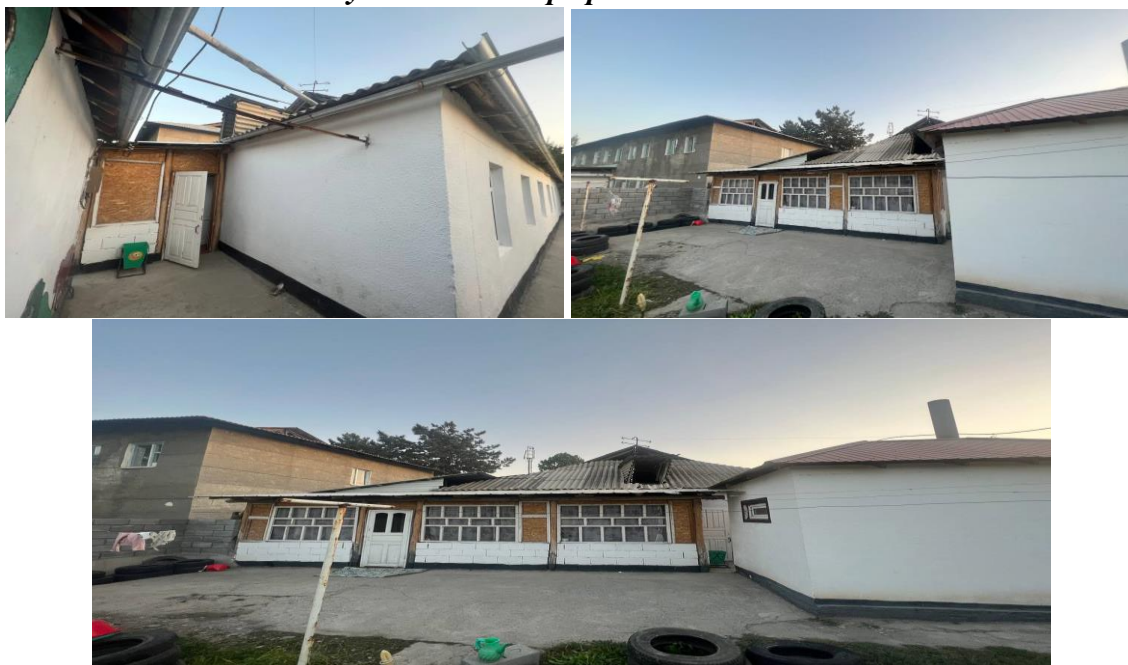
Рисунок 3. Фотографии детского сада