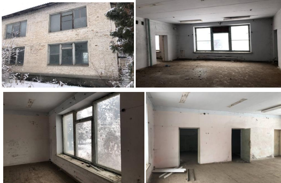
Рисунок 3. Фотографии детского сада