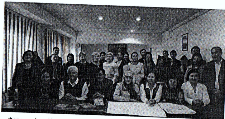
Фотография № 4: Участники семинара по разработке учебников. 13-14 октября 2016 года в г. Бишкек.

13-14 октября 2016 года, ОРП организовал двухдневный семинар для авторов, дизайнеров, иллюстраторов, а также для представителей издательств. Основными задачами семинара были: