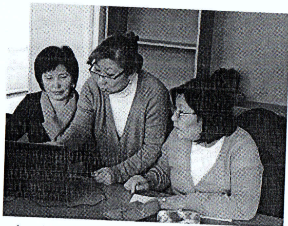
Фото №1: Во время собрания, учителя химии обсуждают вопросы по учебному плану,

дополнения и изменения в Положении о Координационном Совете по стандартам и качеству образования МОН КР; 2) утверждение членов комитетов (Комитет по стандартам и Комитет по учебникам и УМК), 3) экспертное заключение об учебных материалах, 4) презентация и обсуждение предметного стандарта «Кыргызская и мировая литература» (5-9 кл), а также назначение экспертов для оценки, 5) назначение экспертов по экспертизе учебных материалов для подготовительных классов, разработанных издательством «Кутаалам»